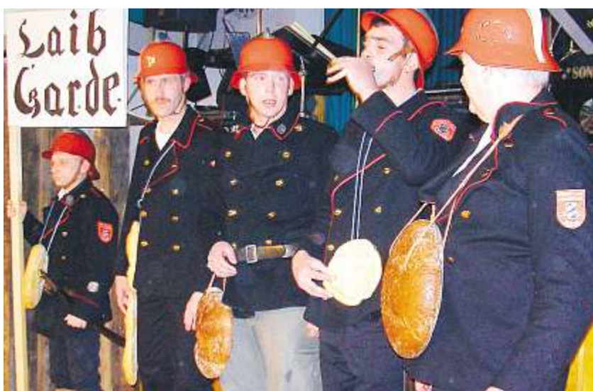
Die „Laibgarde“ des Kaisers in Hab-Acht-Stellung