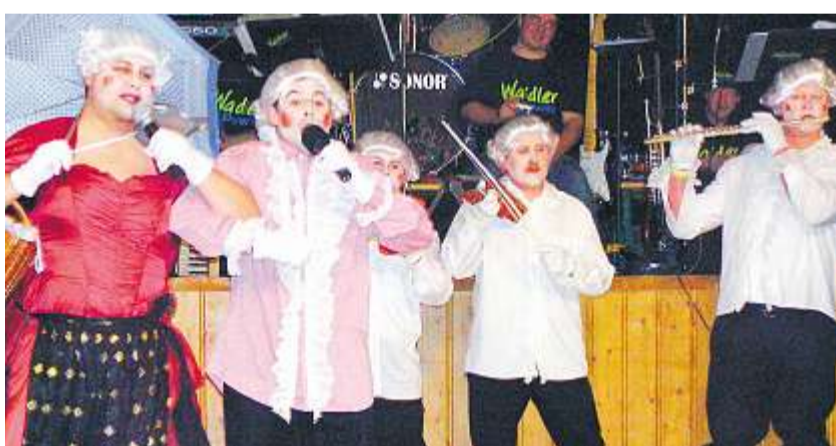
Die kaiserliche Hofkapelle legte einen glänzenden Auftritt hin.