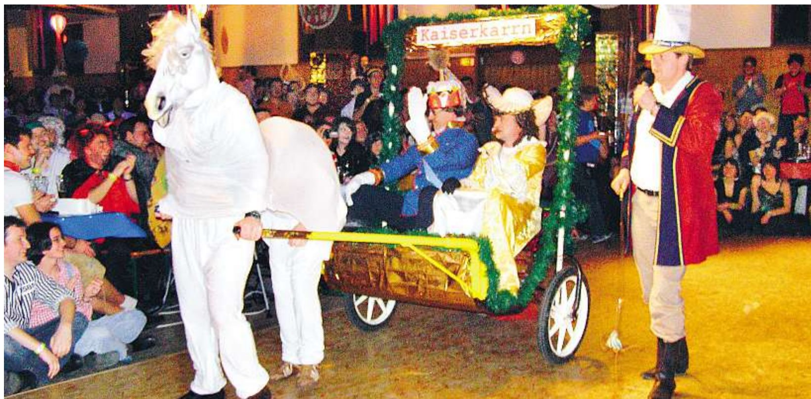
Die kaiserlichen Hoheiten, Franz und Sissi, hielten prunkvoll Hof beim Faschingsball der Prosdorfer Feuerwehr in der Waldmüchner Festhalle.

→ Info und Anmeldung beim Referat Frauenseelsorge, Obermünsterplatz 7, 93 047 Regensburg, Telefon (0941) 597-22 43; E-Mail: frauenseelsorge@bis-tum-regensburg.de