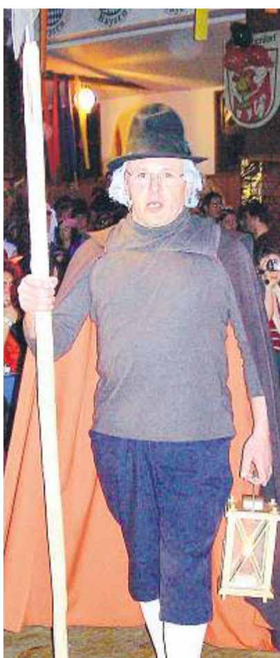
Der Nachtwächter im Anmarsch