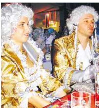
Feine Herrschaften beim Hofball